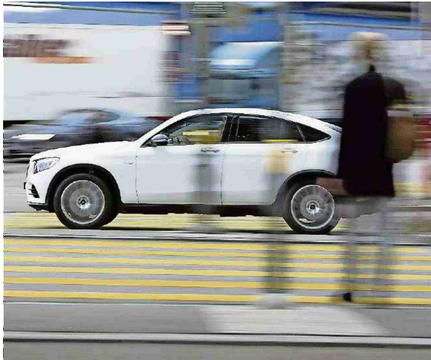
Die Berechnung der Prämien für Autoversicherungen ist umstritten.

Referenz: 73402316 Ausschnitt Seite: 2/2