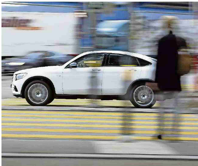
Die Berechnung der Prämien für Autoversicherungen ist umstritten.

Referenz: 73402631 Ausschnitt Seite: 2/2